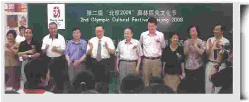
全国人大常委、中国教育国际交流协会会长、中国艺术教育促进会会长柳斌，中国教育学会副会长、联合国教科文组织联合会副主席陶西平，中央电视台副总编辑、中央电视台书画院院长赵立凡，第29届奥林匹克运动会组织委员会新闻宣传部副部长邵王伟、孙维佳，联合国开发计划署驻华助理代表栾丽英等领导出席开幕式，并为展览剪彩。