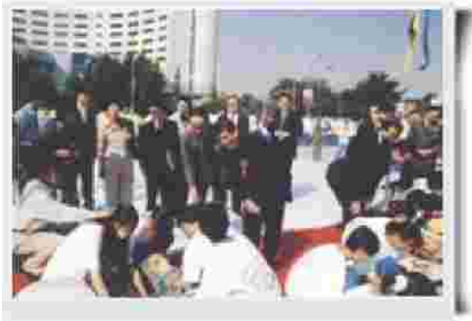
第二十九届奥林匹克运动会组织委员会主席、北京市委书记刘淇和孩子们在一起。