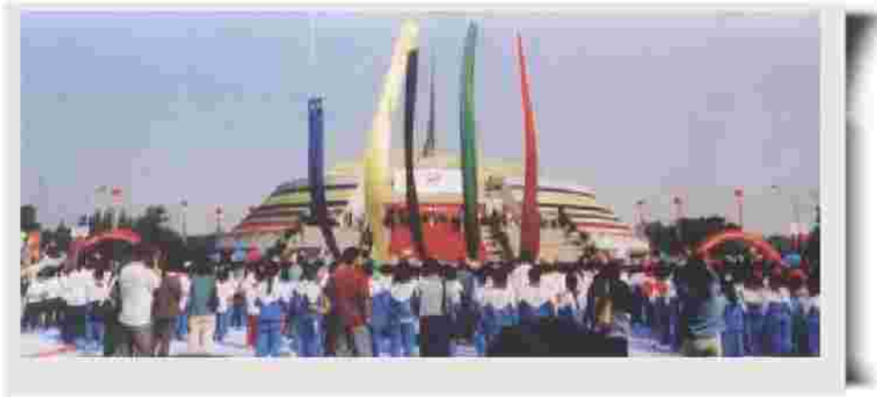
参赛青少年在北京世纪坛举办活动