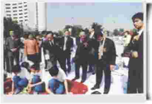
第二十九届奥林匹克运动会组织委员会执行主席、北京市市长王岐山同志和孩子们在一起。