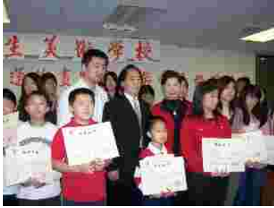
中国驻休斯敦总领事乔红为美南地区获奖青少年颁奖