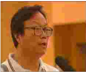
指导教师接受中央电视台采访