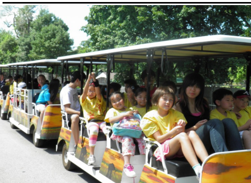
孩子们每天都有收获：在大学的餐厅里进